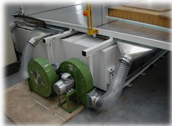
Ventilatori Blowing device